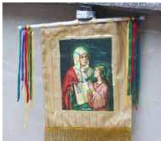
Estandarte de Sant'Ana.

A festa reúne moradores da vila, parentes das regiões próximas e também da cidade de Nova Lima. A celebração é aberta a toda a vizinhança. Durante a festividade, celebra-se uma Missa Conga, antecipada por um cortejo que segue levando a bandeira da santa até a Vila Maria Luiza, entre orações, cânticos, tambores e danças.