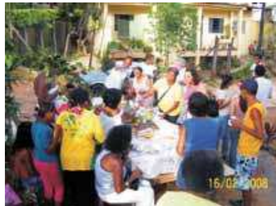
Confraternização à sombra da birosca.