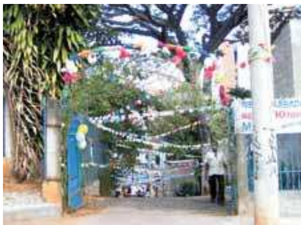
Portão de entrada do Quilombo decorado para a festa de Sant'Ana.