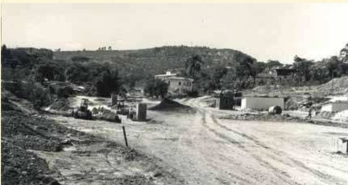
Trecho em obras da Av. Silva Lobo. Acervo SUDECAP Aproximadamente 1970.