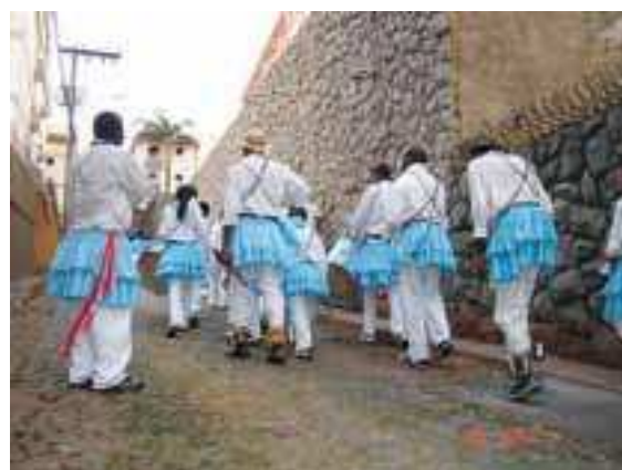
Congado passando pelas ruas do bairro Grajaú.