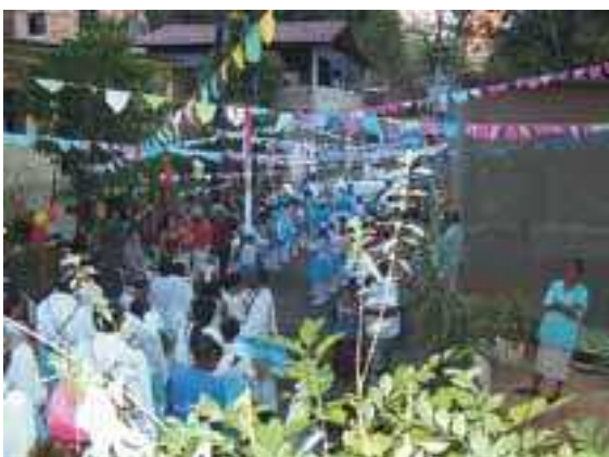
Festa de Sant'Ana.