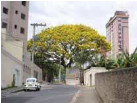
Vista para uma das entradas da comunidade com a birosca ao fundo.

morte de Judas Iscariotes, homem que traiu Jesus Cristo. A Folia de Reis e a congada são relembradas pelos Luízes como festas tradicionais ligadas aos parentes de Nova Lima e contavam com a presença dos familiares.