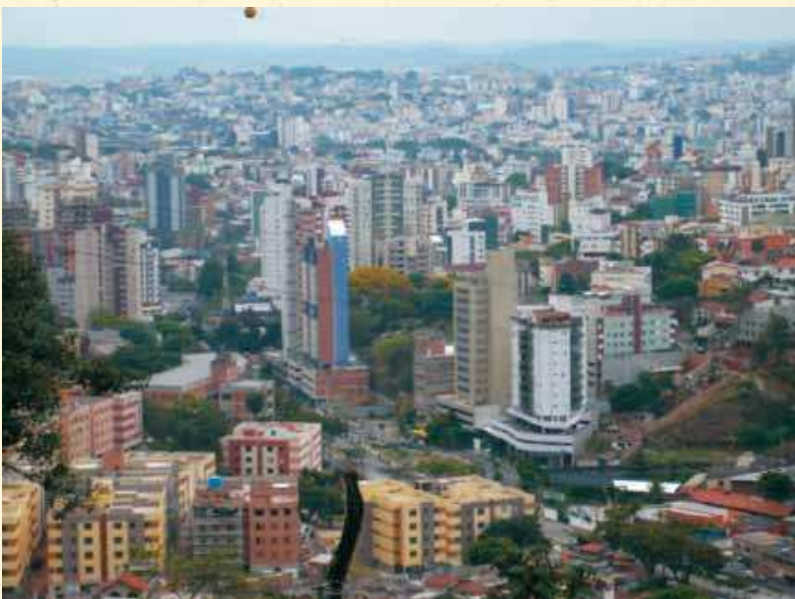
Vista panorâmica a partir da Av Raja Gabaglia. A birosca, no centro da foto, destaca-se na paisagem urbana.