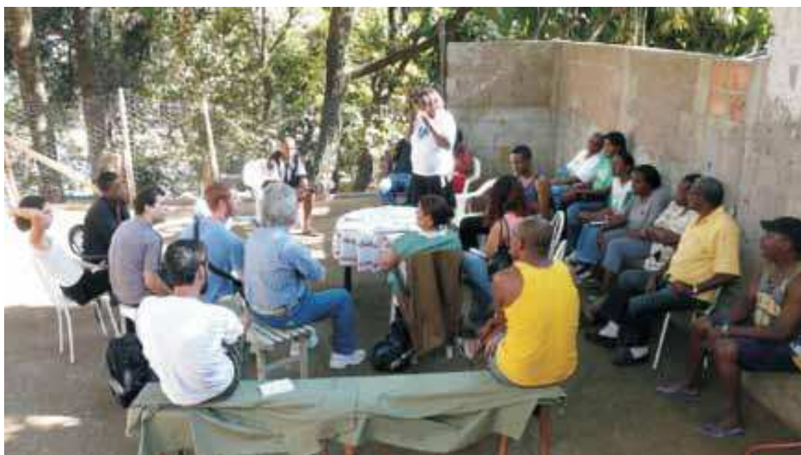
Reunião para discutir o perímetro do território pleiteado.

Para defender seus direitos, os Luízes recorreram a diversas instituições públicas, como a OAB, a Corregedoria da Justiça Federal e a Defensoria Pública. Na maioria das vezes, entretanto, não obtiveram resultados expressivos.