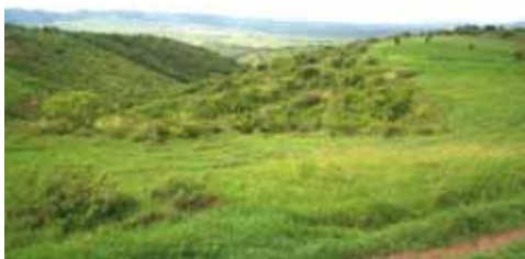
Aspecto de uma das bordas da chã, que compõe a área nobre do território, antes de cair na grotá, vizinha ao Acampamento Tabacaria - 2007

Ao mesmo tempo dessa conquista, os quilombolas continuaram a sofrer pressões por parte dos fazendeiros, inclusive com ameaças de morte e ações violentas contra a comunidade e suas lideranças. Houve