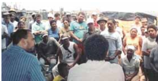
Assembleia inicial de Regularização do Território de Tabacaria – 1º de novembro de 2006

Suas relações humanas e sociais necessárias a um desenvolvimento produtivo das pessoas e da terra que elas virão a ocupar são fortalecidas com vitalidade, responsabilidade e vontade de vencer as dificuldades. Resta-lhes exigir a atenção do poder público, para que sejam garantidas condições de subsistência às famílias de Povoado Tabacaria.