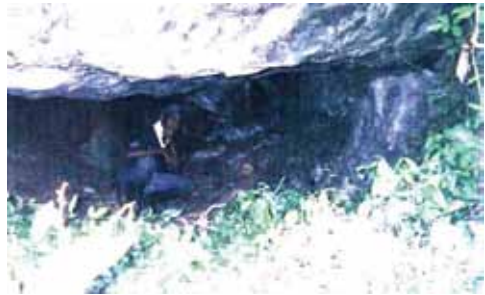
Furna dos Negros. Foto: Aluísio Caetano da Silva – novembro/2006

imaginação ali dentro, e dali eles já tinham o contato dos povos deles e dormiam, comiam, cozinhavam ali perto, o que eles encontravam na mata eles levavam pra ali. Ali era onde era a concentração real deles. (Elson)