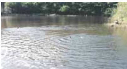
O açude do Farnandes, antiga minação quilombola ampliada pela Fazenda Condic. novembro de 2006

Outro lugar importante é o “Açude do Farnandes”, que foi aproveitado pela Fazenda Condic como açude para abastecer o gado, feito a partir de uma mina d’água descoberta pelos antigos quilombolas.