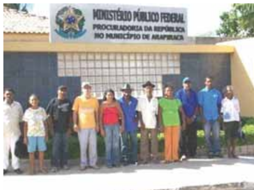
Representantes da Comunidade Quilombola de Povoado Tabacaria – Ministério Público Federal em Arapiraca, Alagoas - 6 de fevereiro de 2007

O RTID da comunidade foi publicado em 2007 e, após muitas negociações a respeito do uso das terras pelos quilombolas e pela fazenda, a portaria do INCRA, reconhecendo e declarando oficialmente o território como remanescente de quilombo, foi publicada em 2008. Em novembro de 2009, o presidente Lula assinou o decreto de desapropriação do território da comunidade de Tabacaria. Sua luta, agora, é por condições dignas para viver e trabalhar no território reconhecido.