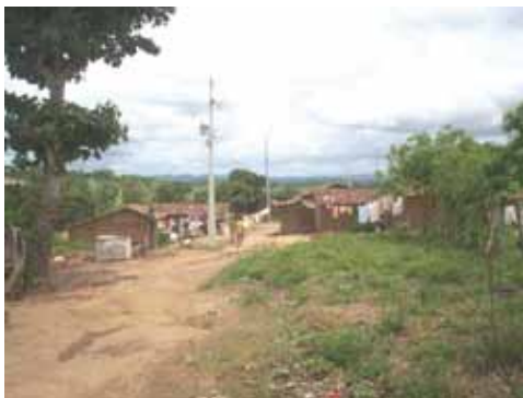
Entrada de Povoado Tabacaria - 2007

dos “moraderos” para dar lugar ao pasto, dificultando a permanência das roças, constantemente destruídas pelo gado. A terra passou a servir de garantia em sucessivas hipotecas bancárias feitas por seus proprietários legais.