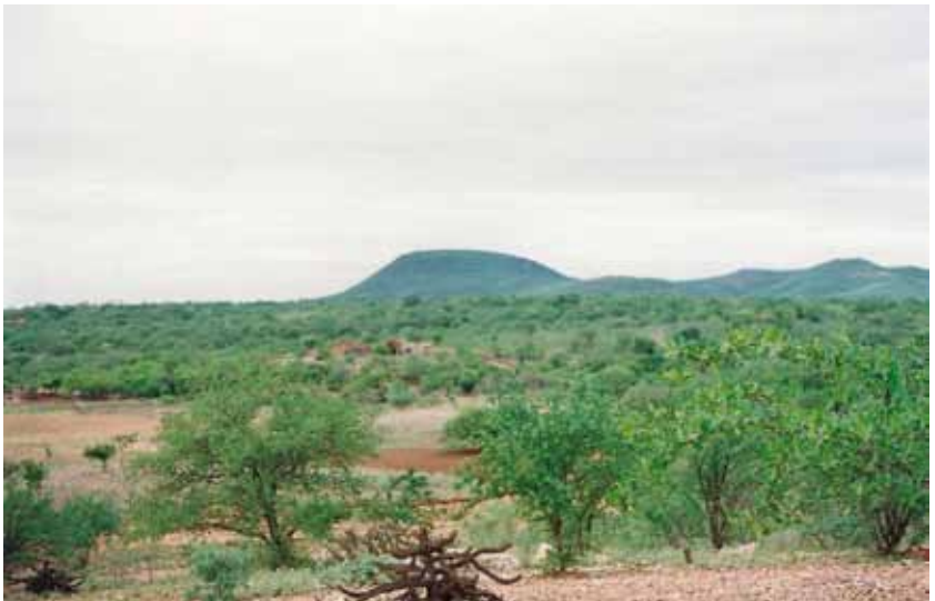
Vista parcial do território Tapuio

As terras do Quilombo Tapuio são reconhecidas pelos quilombolas como seu território ancestral, onde habitam e produzem por muitas gerações. Ali estão os recursos ambientais necessários ao seu bem-estar e à sua reprodução física e cultural, segundo seus usos, costumes e tradições. Além disso, esse espaço constitui uma parte importante de sua história, fundamental para sua integridade política, econômica, social e religiosa. O território aguarda o andamento do processo de titulação pelo INCRA.