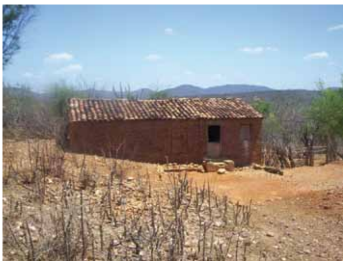
Casa da família Santos

A comunidade Tapuio é cercada por famílias brancas. Nós, negros, ficamos nesta região central. A comunidade sempre foi vista com um olhar negativo. Nas festas, os negros da comunidade não frequentavam festas de brancos porque eles não eram aceitos. Os que podiam ir eram apenas os negros que iam tocar viola. Os brancos falavam que em festa de branco, os negros não participam. Os brancos viam os negros apenas como mão de obra.