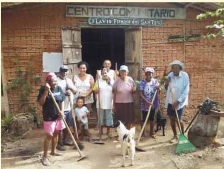
Moradores de Caçandoca em frente ao Centro Comunitário.

O nosso maior sonho é sermos respeitados enquanto quilombolas. Existe hoje um racismo institucional que vem condenando as práticas e os saberes tradicionais, principalmente nas áreas de parque e reserva. Práticas da agricultura, da pesca, da construção das casas são criminalizadas. As comunidades não destroem o território, ele é preservado por causa das práticas quilombolas. Agora, as comunidades crescem, tem filhos, precisam construir mais casas para viverem ali. Como explicar para uma pessoa de 88 anos que ela não pode viver segundo seus modos tradicionais? O saber tradicional também tem que ser mais valorizado, nossos chás e ervas. É necessário mais fomento para a cultura da comunidade para que ela não se perca.