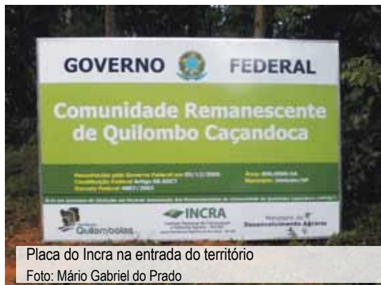
Placa do Incra na entrada do território

Em 2006, a Presidência da República decretou a desapropriação dos 210 hectares da “Fazenda Maranduba”, incluindo outros 200 hectares no território de Caçandoca. O INCRA então ingressou com ação de desapropriação perante a justiça federal de São Paulo. O juiz concedeu o pedido, garantindo assim que os quilombolas pudessem permanecer em suas terras até o encerramento da ação de desapropriação. Essa foi a primeira desapropriação por interesse social que beneficiou uma comunidade de quilombo no país. Atualmente a comunidade está na posse de 410 dos 890 hectares e quando o processo judicial for concluído, a área será titulada em nome da associação. Aguardam, portanto, providências dos governos federal e estadual para finalizar a regularização de suas terras.