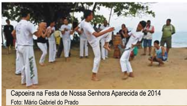
Capoeira na Festa de Nossa Senhora Aparecida de 2014

Ao longo da década de 1970, muitas famílias da Caçandoca foram vítimas de atos de violência e de comprovada má-fé, que as levaram a perder a terra que lhes pertencia. Alguns tentaram recuperá-la por meio de recursos judiciais de reintegração de posse, mas não obtiveram sucesso.