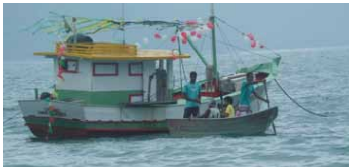
Festa de Nossa Senhora Aparecida de 2014.

(...) a minha avó fazia festa de São Benedito, Santo Antônio, Bom Jesus, fazia festa e fazia bate-pé. Era festa de povo, de vir gente de todos os lugares: Praia Grande, Maranduba, Tabatinga, Sertão da Quina, Saco da Banana, Lagoa, Caçandoca. Casa de assoalho, grande. Tinha que fazer aqueles panelões de comida, matava bastante porco, pato, galinha. À noite era o baile. Os músicos vinham de Maranduba – violão, pandeiro, violino, cavaquinho.