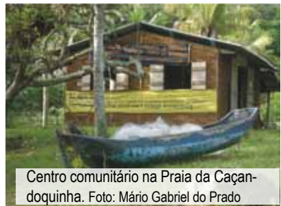
Centro comunitário na Praia da Caçandoquinha.